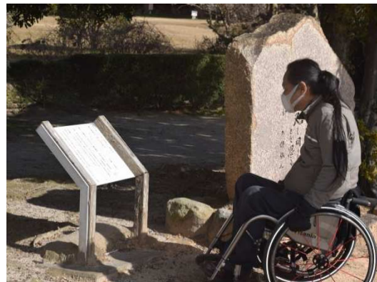
（車いすユーザーと政庁跡前の万葉歌碑を検証する様子）