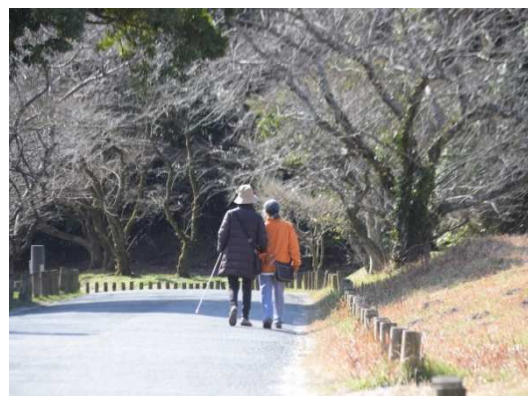
（視覚障がい者の方と大宰府政庁跡から坂本八幡宮へのルートを検証する様子）