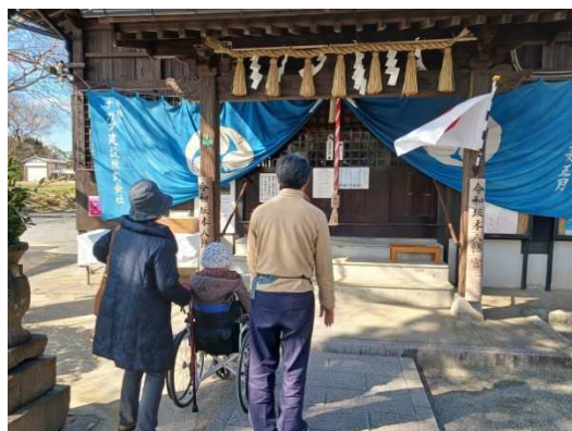
（車いすユーザーと坂本八幡宮参拝を検証する様子）