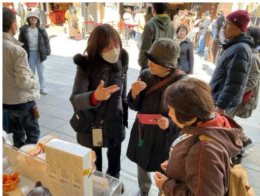
（聴覚障がい者の方と天満宮参道を検証する様子）

太宰府市内の観光施設のバリアフリー調査を、当事者参加型のモニターツアー形式で行いました。誰もが楽しむことができる観光地だざいふを目指して、今後も環境整備に努めていきます。