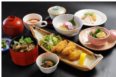
▲かなわ 食事券1名様 (おひとり様3,000円分)