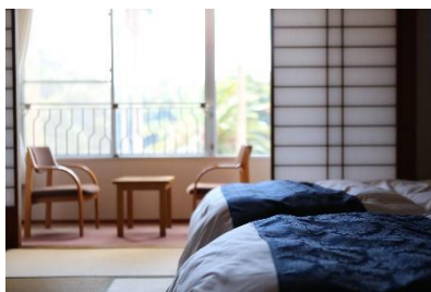
▲休暇村大久野島 ペア宿泊券 1 名様（1 泊 2 食付き）