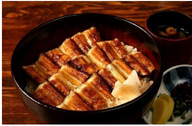
▲あなごめしうえの ペア食事券1組様 (おひとり様6,000円分)