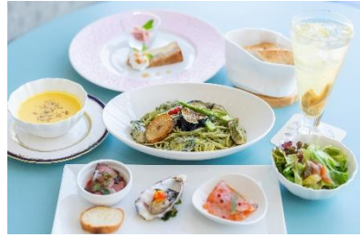
▲OYSTER CAFE ETAJIMA ペア食事券1組様 (おひとり様5,000円分)