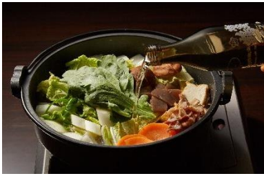
▲日本酒ダイニング 佛蘭西屋 ペア食事券1組様 (おひとり様5,000円分)