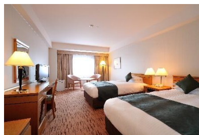
▲広島エアポートホテル ペア宿泊券 1 名様（1 泊朝食付き）