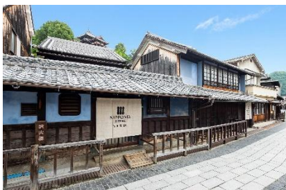
▲NIPPONIA HOTEL 竹原 製塩町 ペア宿泊券 1 名様（1 泊 2 食付き）