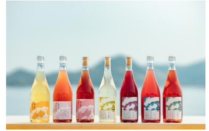
▲瀬戸内醸造所レストラン mio ペア食事券1組様 (おひとり様5,000円分)