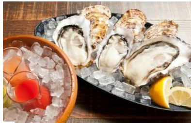
▲Oyster Bar MABUI ペア食事券1組様 (おひとり様5,000円分)