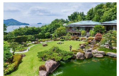
▲庭園の宿 石亭 ペア宿泊券 1 名様（1 泊 2 食付き）