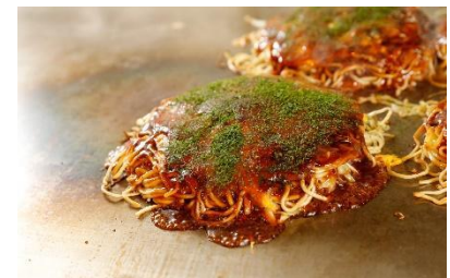
▲お好み焼 みっちゃん総本店 食事券3名様 (おひとり様5,000円分)