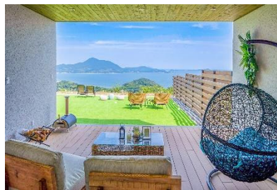
▲LEMON FARM GLAMPING しまなみ ペア宿泊券 1 名様（1 泊 2 食付き）