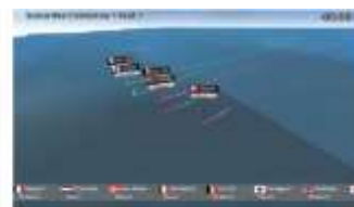
みどころ バーチャルレースで順位を確認