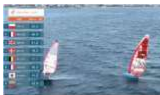
みどころ リアルタイム速度表示