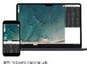
※特: N Sports tracking Lab