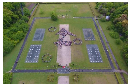
(大宰府政庁跡 ※5 )

太宰府市、NPO 法人バリアフリーネットワーク会議、全日本空輸株式会社(本社:東京都港区)、ANA あきんど株式会社(本社:東京都中央区)は、ユニバーサルデザインに基づく総合的な移動サービス「Universal MaaS」の共同プロジェクトを開始します。