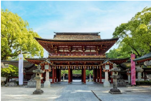
(太宰府天満宮 ※4 )