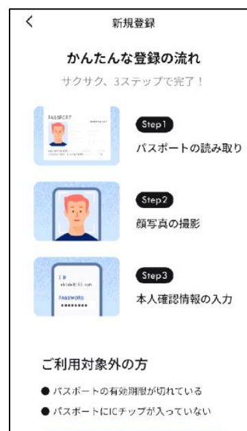
モバイルアプリ画面