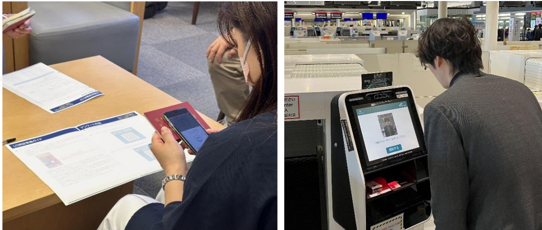
成田空港における実証実験の様子

2021 年から成田空港で導入している「Face Express」は、NEC の世界 No.1(注 6)の認証精度を有する顔認証技術を活用しています。チェックインなど空港での最初の手続きの際にパスポート・搭乗券・顔写真情報を登録すると、従来必要であった搭乗券やパスポートを提示することなくその後の搭乗手続き（手荷物預け、保安検査場入場、搭乗ゲート通過）に進むことができます。