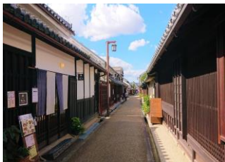
（橿原市今井町の街並み）