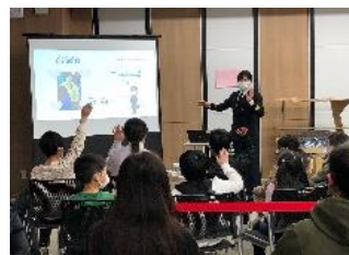
※画像はすべてイメージ