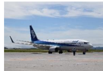
※画像はすべてイメージ