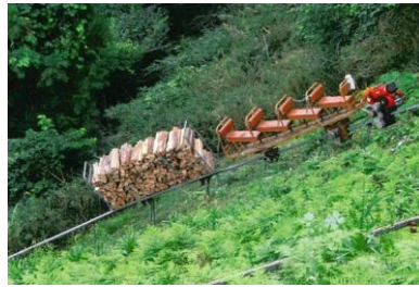
山頂での作業の様子