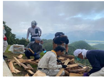
山頂での作業の様子

近年、協賛金の減少、鳥獣被害、関係者の高齢化等の課題から継続の危機に立たされており、コロナ後 4 年ぶりの本格実施に先立ち、地域の方以外にも広く知っていただき、丹波の「大」の文字を伝統行事として守っていきたい、と一丸となって取り組んでおります。