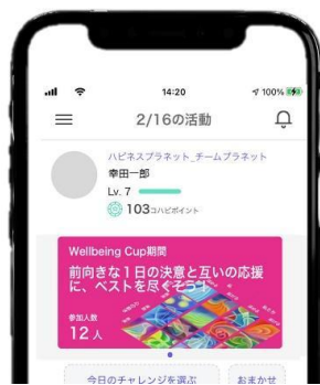
ハピネスプラネット アプリ