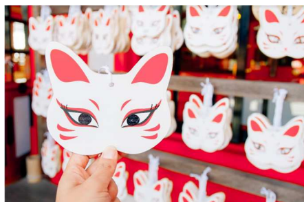
太鼓谷稲成神社(津和野町)