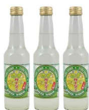
1.ゆずサイダー(益田市)