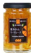
3.夏みかんマーマレード(萩市)