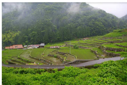
大井谷棚田(吉賀町)