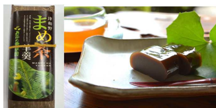
2.秀翠園まめ茶ようかん(津和野町)