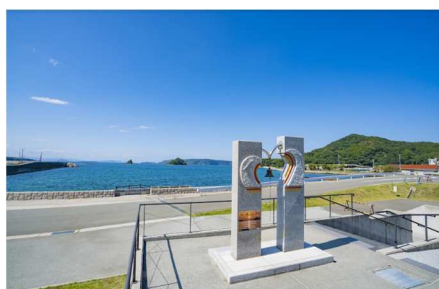
道の駅阿武町(阿武町)