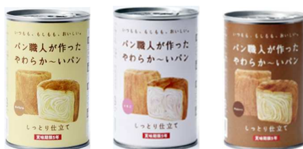
5.パン職人が作ったやわらか〜いパン(吉賀町)