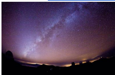
すばる望遠鏡 マウナケアにかかる天の川

詳細 URL : https://www.ana.co.jp/ja/jp/travel/onlinetour/