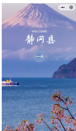
起動時バナーページ