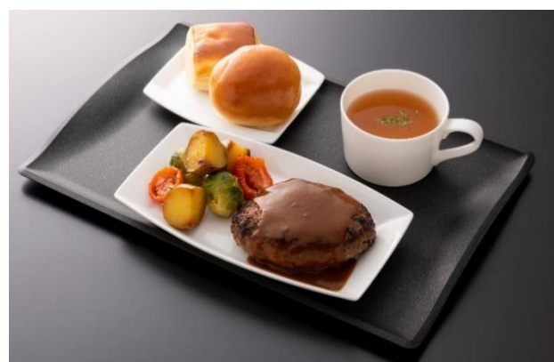
「SUITE DINING」メニューの一例 ANAオリジナルビーフハンバーグステーキセット

ANAは、4月27日(水)より、羽田空港・成田空港 国際線 ANA SUITE LOUNGEにて、これまでのビュッフェや麺類のメニューに加え、時間帯により提供内容が変わるセット形式の新たなお食事サービス「SUITE DINING」の提供を開始します。「SUITE DINING」ではお食事をワントレイに配膳し、11:00までは和食・洋食の朝食メニュー、11:00以降は和食・洋食の昼夕食メニューを提供します。従来のビュッフェ形式のお食事に加え、対面・接触の機会を低減する新たなサービスの選択肢をご提供します。