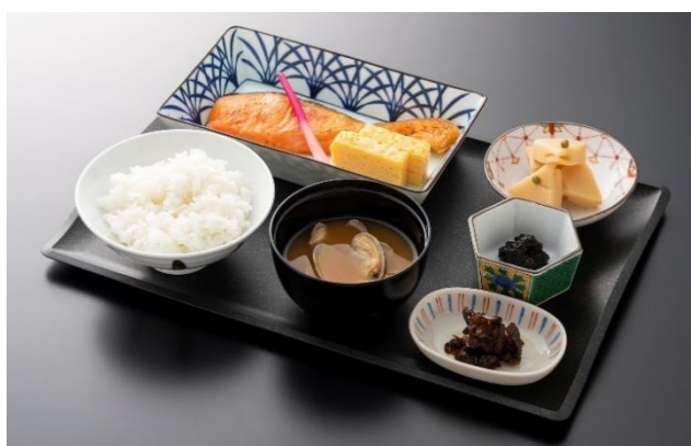
「SUITE DINING」メニューの一例 鮭の塩焼きセット