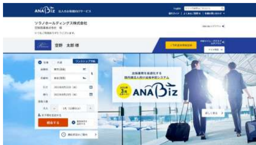
「ANA Biz」サイト画面イメージ