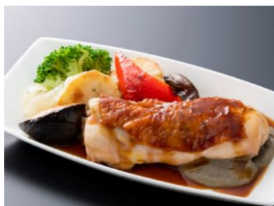
チキンのソテー 有馬山椒の香るフォンドポソース (兵庫県)