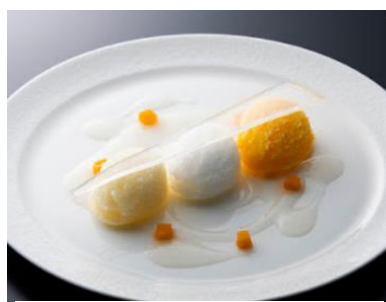
3種のアイス盛り合わせ (奈良県)