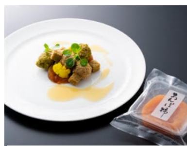
フォアグラのブローケン、 和歌山県産あんぼ柿のコンポートと 梅のピューレソース (和歌山県)