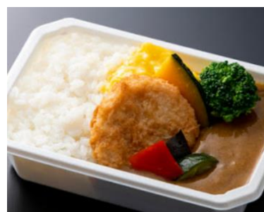
大阪大黒ソースチキンカツカレー (大阪府)