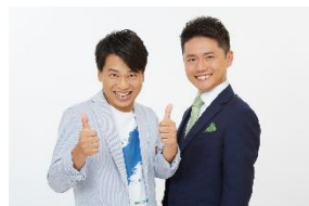
滋賀県 出演者：ファミリーレストラン （ハラダ/しもばやし）