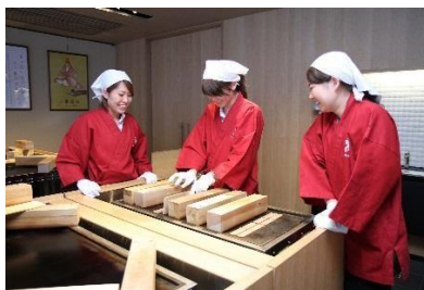
京都府【井筒ハッ橋本舗 ハッ橋手焼き体験】 人の往来でにぎやかな町の中心に位置する 「京極一番街」で旅の思い出作り。