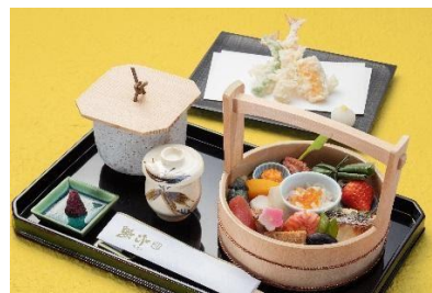
京都府【京料理 六盛】 京料理の旬な食材を色とりどり盛り込んだ 「手をけ弁当」をぜひお召し上がりください。