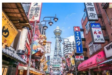
大阪府【通天閣 入場券】 幸福の神様ピリケンも鎮座している高さ 108mの大阪のシンボルタワー。