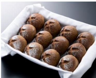
ほうじ茶カンパーニュ (滋賀県)