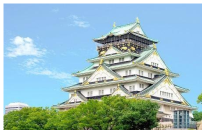
大阪府【大阪城天守閣 入館券】 文化財の展示や展望台からの眺めなど 国内外の観光客に人気のスポットです。