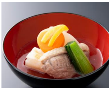
鴨の雑煮椀 (京都府)