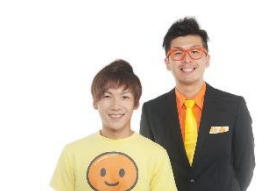
和歌山県 出演者：わんだーらんど （まことフィッシング/たにさか）