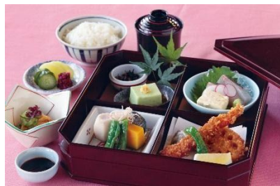
京都府【百屋ランチ】 ANA オリジナルランチです。京の町屋で 優雅なお食事のひとつときを。