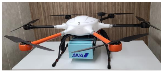
GT-500（ペイロード 5 kg）