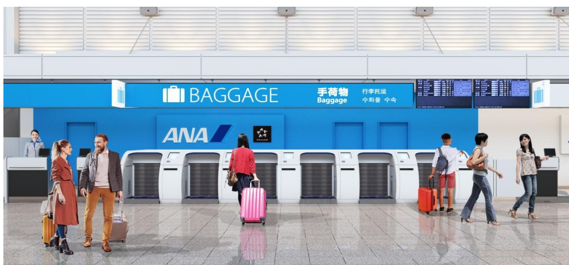
伊丹空港 1階 出発カウンター（イメージ）

～「ANA Baggage Drop」導入は5空港目、全国で79台、より便利に～