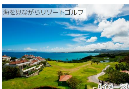
海を見ながらリゾートゴルフ