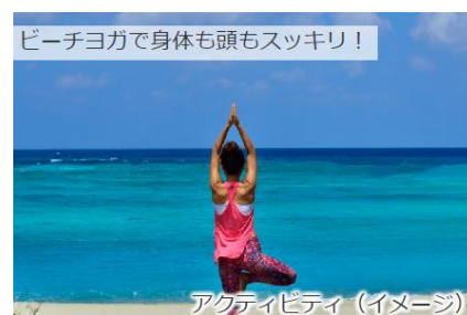
ビーチヨガで身体も頭もスッキリ!