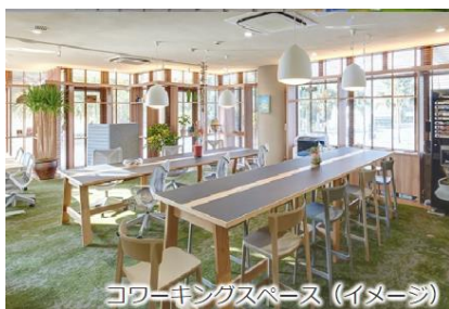
コワーキングスペース (イメージ)