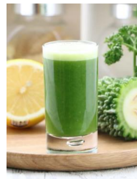
ご提供スムージー（イメージ）