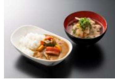
ベジタブルカレー・けんちん汁

「ANA SUITE LOUNGE」ではビュッフェメニューに加え、山菜稲庭うどんや出汁茶漬けなどのアラカルトメニューもご提供します。