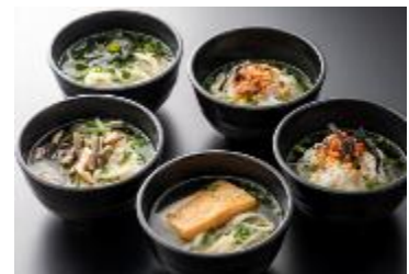
稲庭うどん・出汁茶漬け

「ANA SUITE LOUNGE」ではビュッフェメニューに加え、山菜稲庭うどんや出汁茶漬けなどのアラカルトメニューもご提供します。