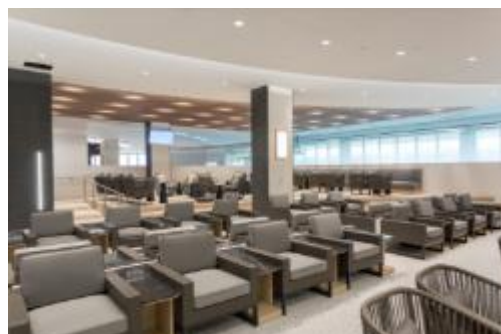
ANA SUITE LOUNGE