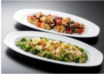
洋食ビュッフェメニュー

「ANA SUITE LOUNGE」および「ANA LOUNGE」では、マヒマヒ(白身魚)のソテーやハワイアンBBQチキンなど、お食事からもハワイらしさを感じていただけるメニューに加え、牛豆腐や豚しょうが焼きなどの和食メニューをビュッフェ形式でご提供します。