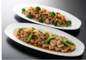
和食ビュッフェメニュー