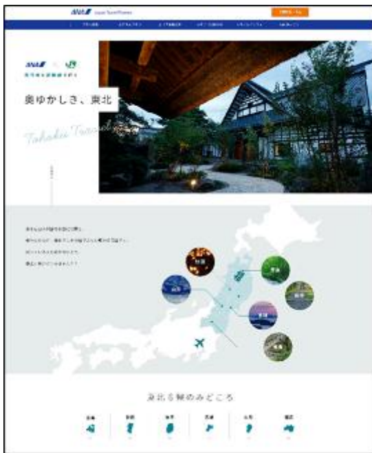
【Japan Travel Planner サイト】

※英語、中国語（中国簡体字、台湾繁体字、香港繁体字）、韓国語、ドイツ語、フランス語、タイ語、インドネシア語、ベトナム語、日本語の11言語で展開する予定です。