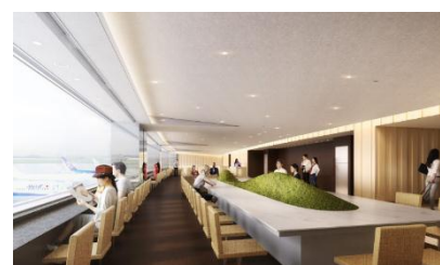
リニューアル後のANA LOUNGE