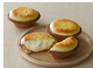
焼きたてチーズタルト