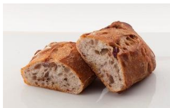
くるみとクランベリー

北海道の食材にこだわり、丁寧に焼き上げた香ばしいタルトの食感とチーズの味わいをお楽しみください。