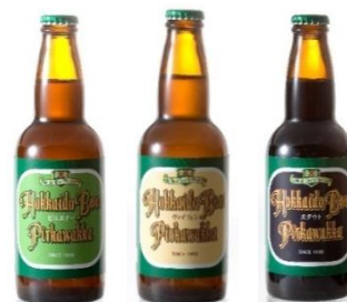
ピルスナー・ヴァイツェン・スタウト

※上記の北海道にまつわるメニューのほかに、おかし、アルコールとソフトドリンクもご提供いたします。