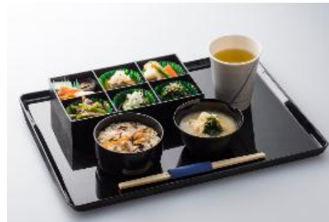
羽田＝伊丹線の昼食・夕食例

さらに、夕食時間帯においては、羽田発便では「らかん亭」、伊丹・新千歳・福岡・沖縄(那覇)発便においては「馳走 啐啄(そったく)」とのコラボレーションメニューをお楽しみいただけます。