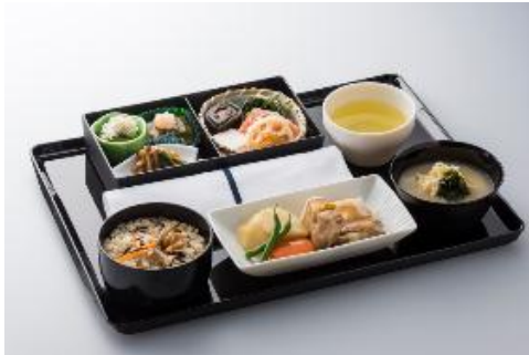
羽田＝新千歳/福岡/沖縄(那覇)線の昼食・夕食例

また、朝食・昼食・夕食の時間帯において、羽田発着の一部の路線(羽田⇄伊丹・新千歳・福岡・沖縄(那覇))のメニューを一新し、こだわりの器に盛り付けた、こだわりの機内食をお届けします。