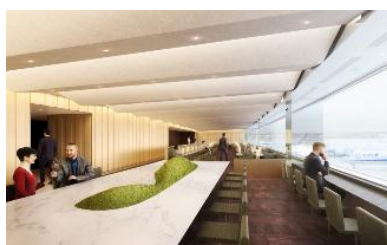
新設されるANA SUITE LOUNGE