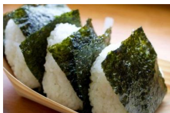
おにぎり2種(鮭・昆布)