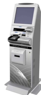
新自動チェックイン機

新自動チェックイン機の導入により、預け手荷物のためのタグ印刷が可能*となります。このタグをお客様ご自身で貼付いただくことで、カウンターでの待ち時間を短縮することが可能になります。(*7月中旬サービス開始予定)